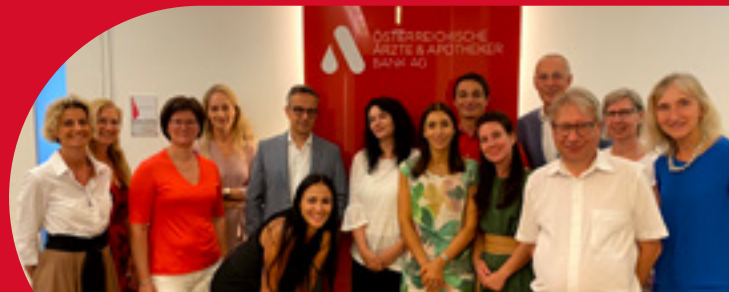
Jubiläumsfeier am 05.09.2023 - 165 Jahre geballte Kompetenz