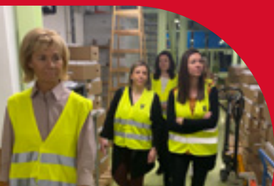
Besuch des Logistikzentrums Wien des Kooperations- partners Herba Chemosan Apotheker-AG