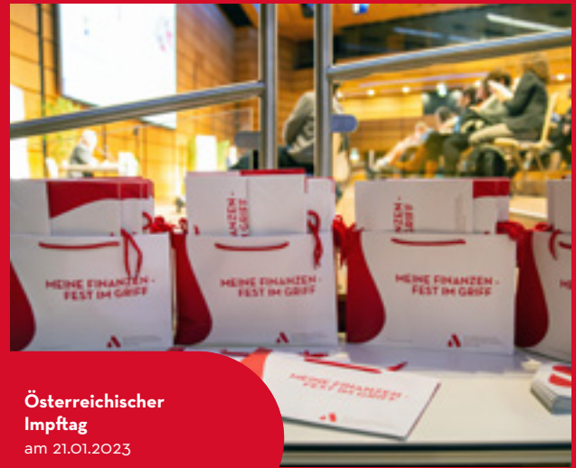
Österreichischer Impftag am 21.01.2023