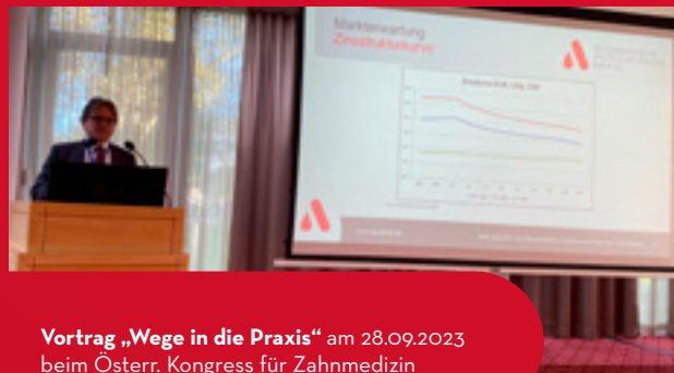
Vortrag „Wege in die Praxis“ am 28.09.2023 beim Österr. Kongress für Zahnmedizin