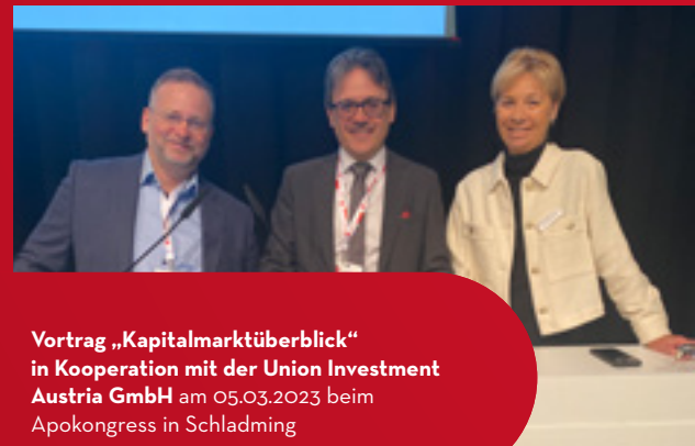
Vortrag „Kapitalmarktüberblick“ in Kooperation mit der Union Investment Austria GmbH am 05.03.2023 beim Apokongress in Schladming