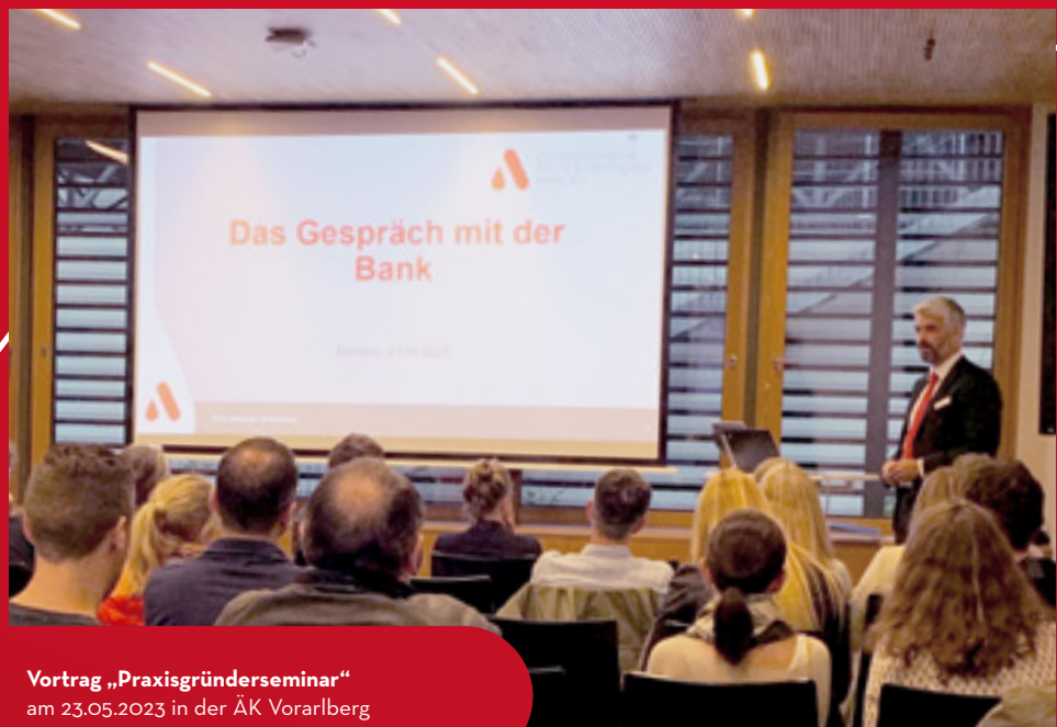
Vortrag „Praxisgründerseminar“ am 23.05.2023 in der ÄK Vorarlberg