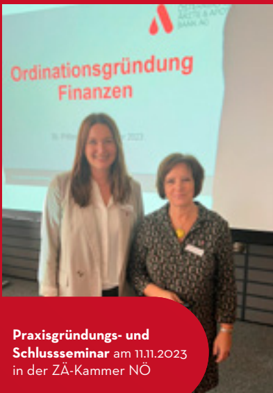
Praxisgründungs- und Schlusseminar am 11.11.2023 in der ZÄ-Kammer NÖ