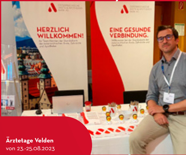
Ärztetage Velden von 23.-25.08.2023