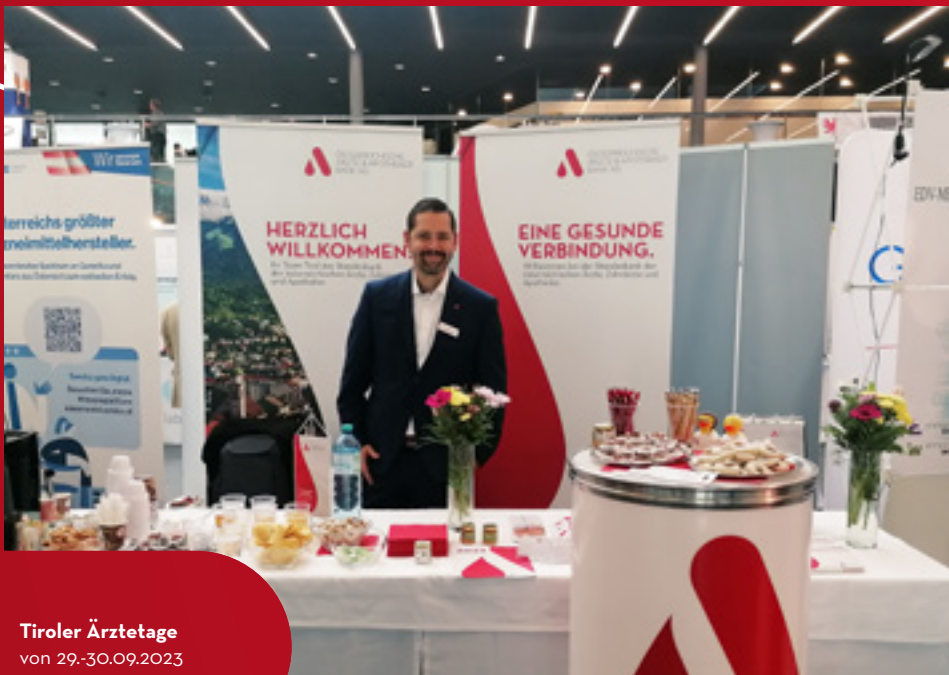
Tiroler Ärztetage von 29.-30.09.2023