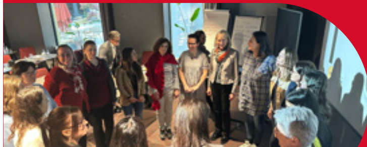
Impulstag der Vertriebsassistentz im Hotel Radisson Red am 28.04.2023