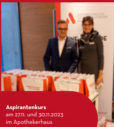
Aspirantenkurs am 27.11. und 30.11.2023 im Apothekerhaus