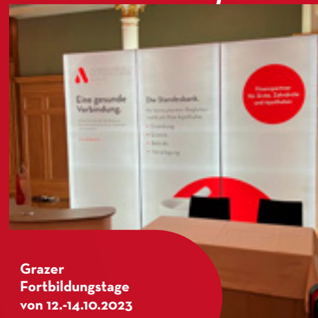
Grazer Fortbildungstage von 12.-14.10.2023