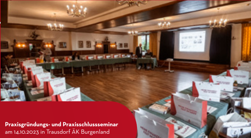
Praxisgründungs- und Praxischlussseminar am 14.10.2023 in Trausdorf ÄK Burgenland