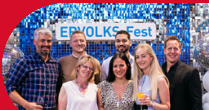
ERVOLKS-Fest am 02.06.2023