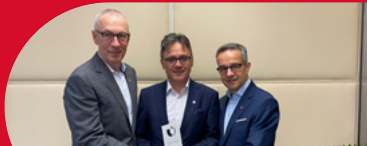
Prix de Fonds 2023 - Diese Auszeichnung erhielt die Bank in Frankfurt von ihrem Kooperationspartner Union Investment Austria GmbH

Leistungsfähigkeit, Rentabilität und eine solide Eigenmittelausstattung nehmen in der Geschäftspolitik einen hohen Stellenwert ein.