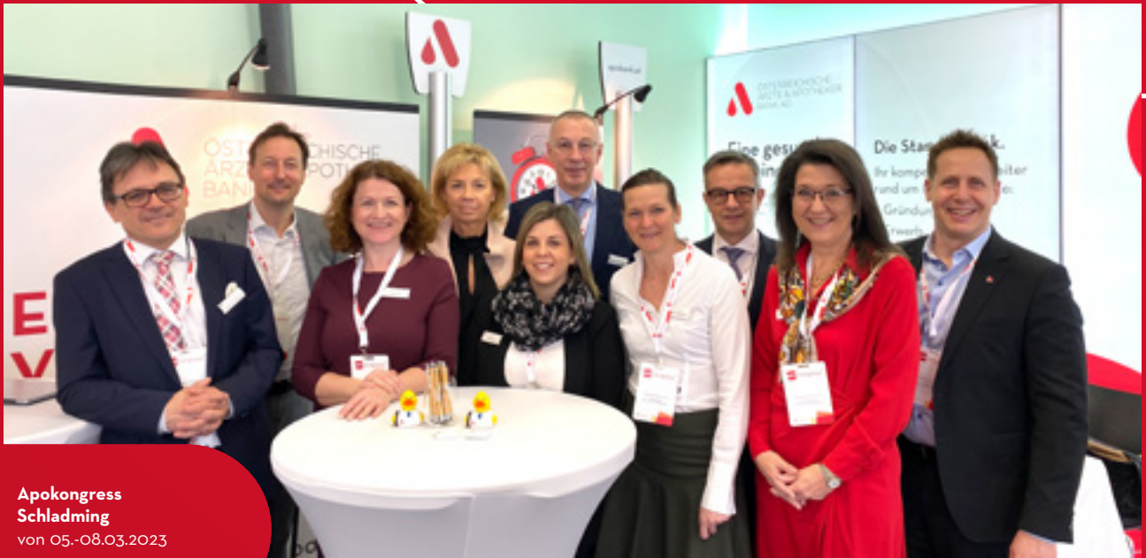
Apokongress Schladming von 05.-08.03.2023