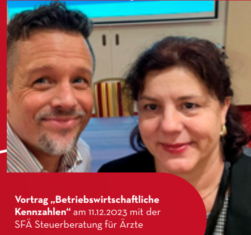
Vortrag „Betriebswirtschaftliche Kennzahlen“ am 11.12.2023 mit der SFÄ Steuerberatung für Ärzte