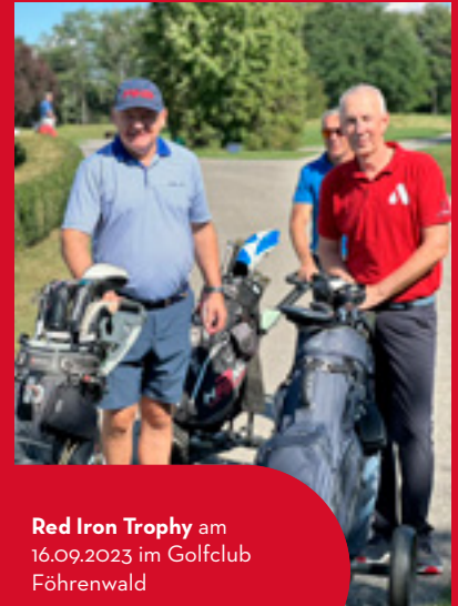
Red Iron Trophy am 16.09.2023 im Golfclub Föhrenwald